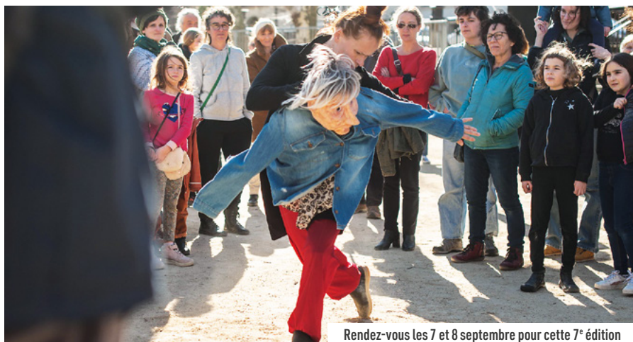
Rendez-vous les 7 et 8 septembre pour cette 7 e édition

Le festival des arts de la rue se propagera dans le centre-ville les 7 et 8 septembre prochains.